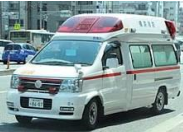
(救急車のイメージ写真)

今年度事業として消防車両の整備が進んでいましたが、20日に消防本部にて展示が行われ、各署・分署に配備された。並木分署には、高規格救急自動車に配置されることになりました。